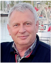
von Dr. med. Thomas Völler, Grünheide

Wir alle sind offene Energiesysteme, die sich im ständigen Austausch mit der Umgebung befinden und damit elektromagnetischen Belastungen ausgesetzt sind.